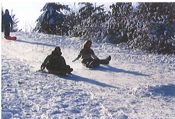
Billede: Vintersjov på kælkebakken

Herefter kører natbussen til overnatningsstedet: Nordals Idrætscenter