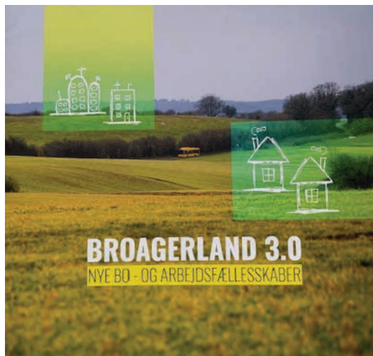
Denne pjece fortæller, hvordan visionen skal omsættes til virkelighed.

Tilblivelsen af disse materialer er sket i et samarbejde mellem styregruppen og mange forskellige ildsjæle. Alle materialerne kan tilgås på hjemmesiden www.broagerland.dk .