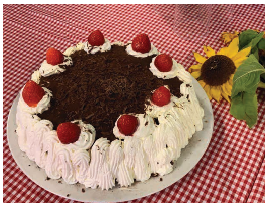
Vi fejrede os selv med brødtort.

Kendskabet til Broagerland 3.0 er også blevet stort uden for de lokale kredse. Det er blevet et eksempel på et grænseoverskridende og ambitiøst udviklingsprojekt startende som en løs idé af en håndfuld ildsjæle. Nomineringen som Årets Landsby 2021 indikerer det i sig selv.