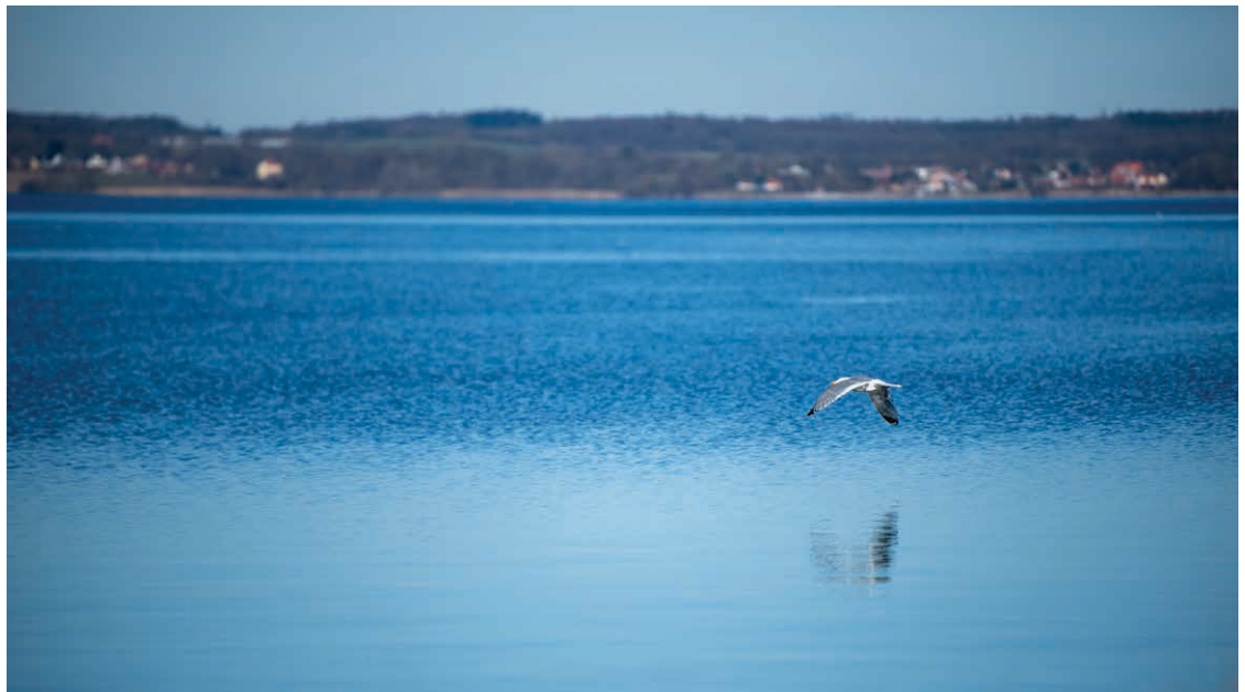
Broagerland er omkranset af vand.

For at stå stærkere er der i den nye forening lagt op til en bestyrelse sammensat af både lokale og eksterne med nødvendige kompetencer, som de lokale ikke måtte være i besiddelse af. Tilstedeværelsen af de nødvendige kompetencer bliver ikke mindst centralt, når den kommende erhvervsdrivende fond skal godkendes, jf. reglerne på området.