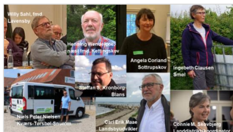
Billeder fra workshoppen den 13/10 på Center for Verdensmål

(Projektet og deltagelsen er støttet med midler fra "Puljen til Borgerinitiativer" i Sønderborg Kommune).