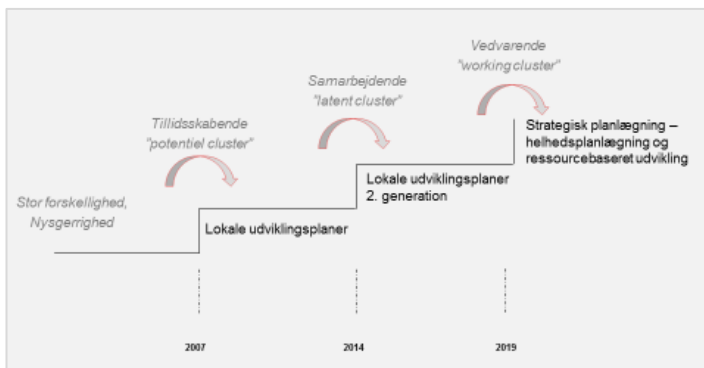
Figur 3 – visuel tegning af landdistriktsudviklingen i Sønderborg kommune

I denne periode er antallet af landsbylaug steget fra 21 til 32. Landsbylaugene har rettet blikket mod et fælles mål, som bestyrelserne styrer hen imod.