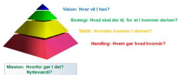
Figur 1 – forståelsesramme

Denne forståelsesramme giver grundlag for at arbejde henimod bedre dialog og kommunikation, der giver en positiv effekt på samarbejdet med forvaltningen og politikerne.